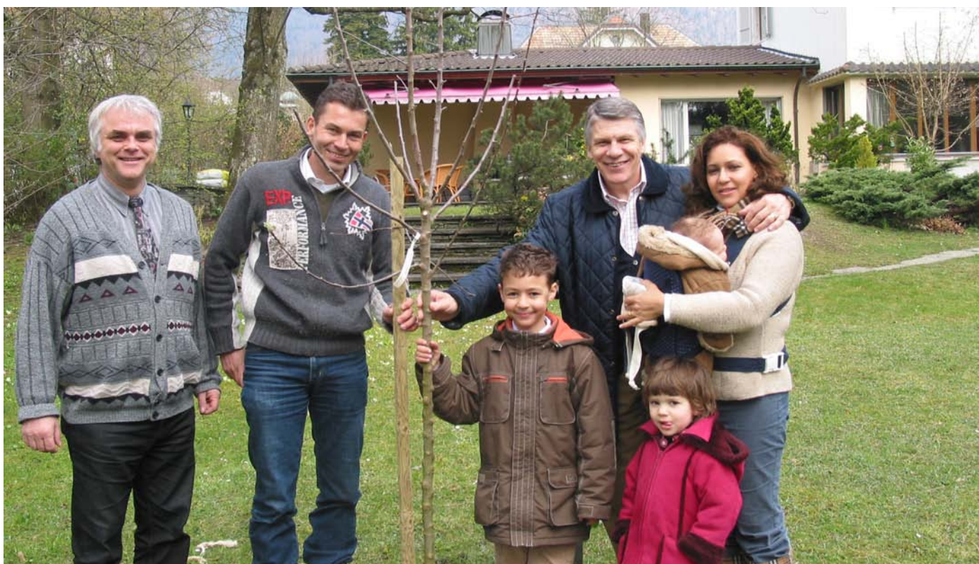
Zur Geburt Ihres Kindes oder Enkelkindes schenken wir Ihnen einen Obstbaum.

Sie besitzen die Bäume und wir das Fachwissen, damit sie sicher sind. Pioniergeist und ein Herz für Bäume haben wir gemeinsam. Sonst würden Sie sich nicht für die Baumversicherung entscheiden – und wir hätten die Idee für den Baumclub nicht gehabt.