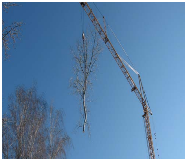
Wir organisieren sofort die Baumfällung und beraten unsere Kundin in einer Baumschule bei der Auslese des Ersatzbaumes.