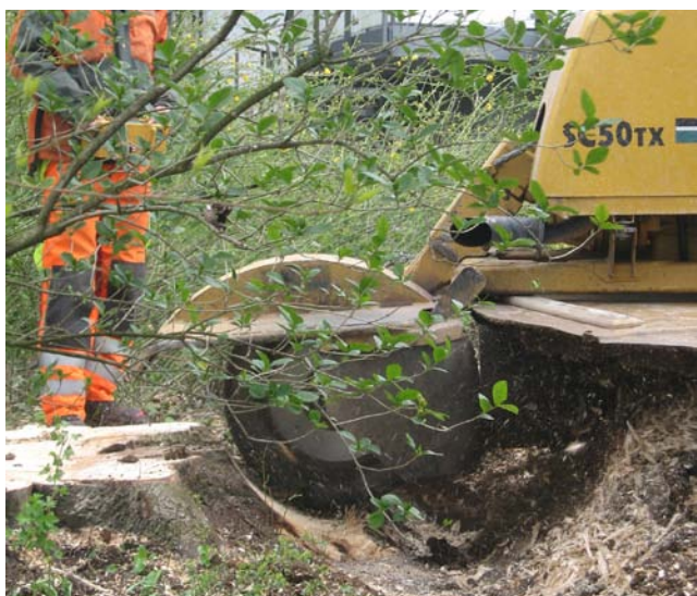
Der Wurzelstock wird ausgefräst und...