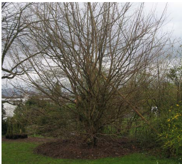
Wo noch am Morgen der beschädigte Zuckerahorn stand, ist bis am Abend der neue, 7m hohe Baum gepflanzt, und die Helvetia übernimmt die gesamten Schadenskosten von CHF 12'090.--.