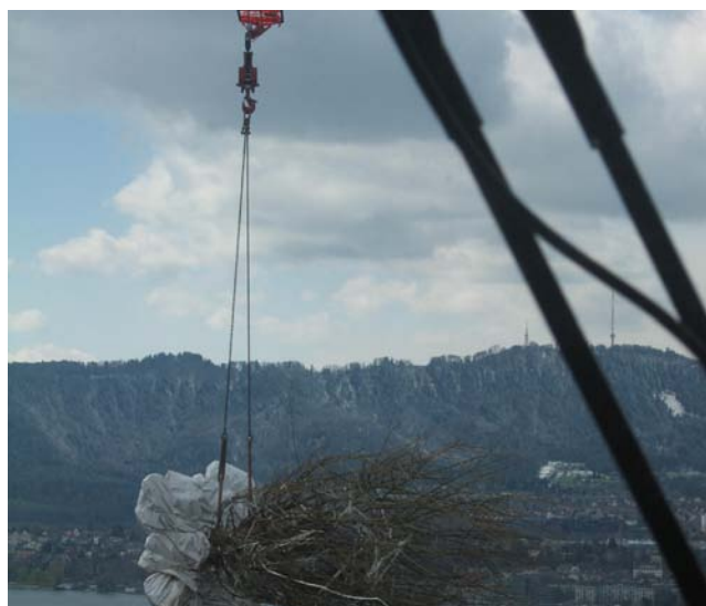
...der neue Baum mit dem Kran in die Pflanzgrube geht.