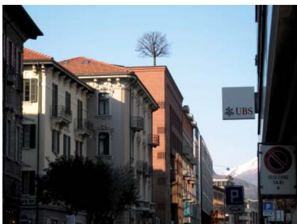
Die Spezialisten der Helvetia versichern auch solche Bäume!