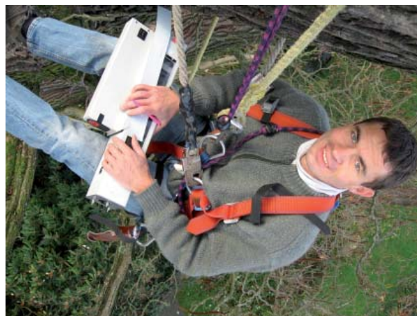
Wir untersuchen die Bäume von Kopf bis Fuss.