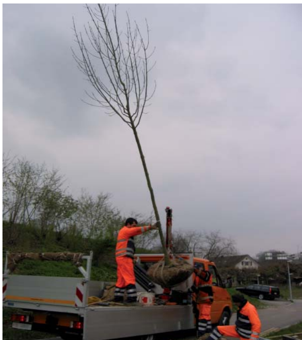
Die Helvetia vergütet auch die Lieferung und Pflanzung des neuen Baumes.