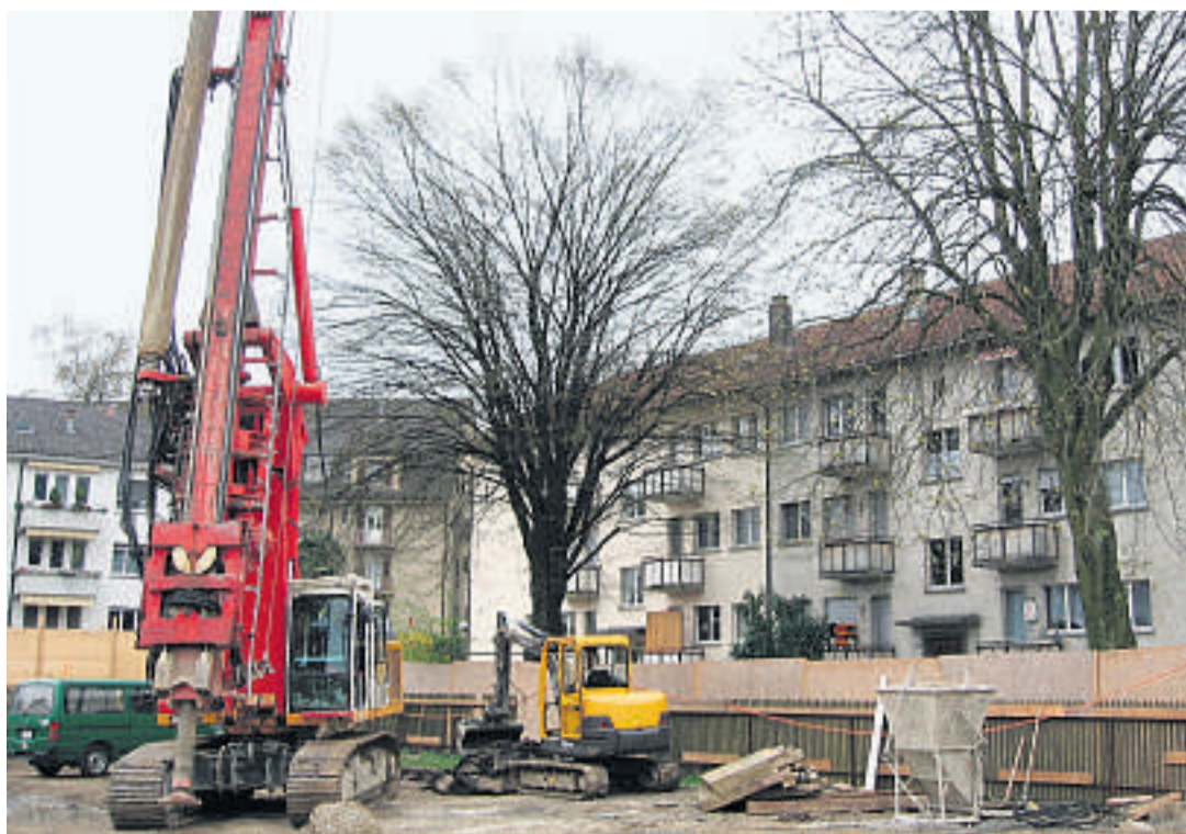
Unterschätzte Gefahren: Gerade auch Bäume auf Baustellen brauchen entsprechenden Schutz.