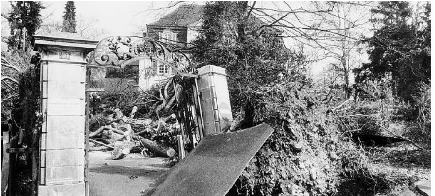
Schwere Stürme können verheerende Folgen für Ihr Haus haben. Jahrzehnte alte Bäume werden entwurzelt und sind, wenn sie auf Häuser fallen, eine Gefahr für Leib und Leben. Darum lohnt es sich, vom Fachmann eine Analyse über den Zustand Ihrer Bäume auf Ihrem Grundstück machen zu lassen.