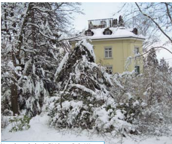
Nassschneescha-den in Zürich von Ende März.